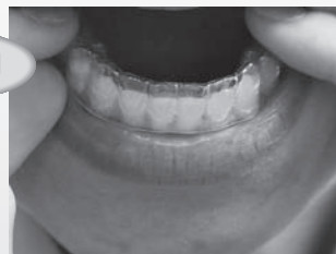
透明でマウスピースタイプの矯正装置