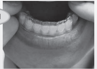
透明でマウスピースタイプの矯正装置